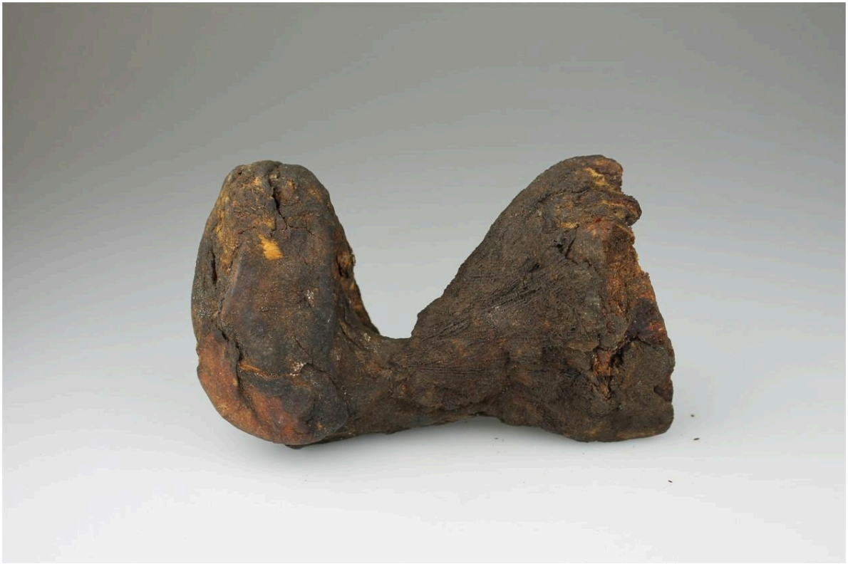
Le buste et la tête d'une momie de chat, sans ses bandages, donnée après la vente aux enchères du 10 février 1890 et conservée au World Museum de Liverpool.