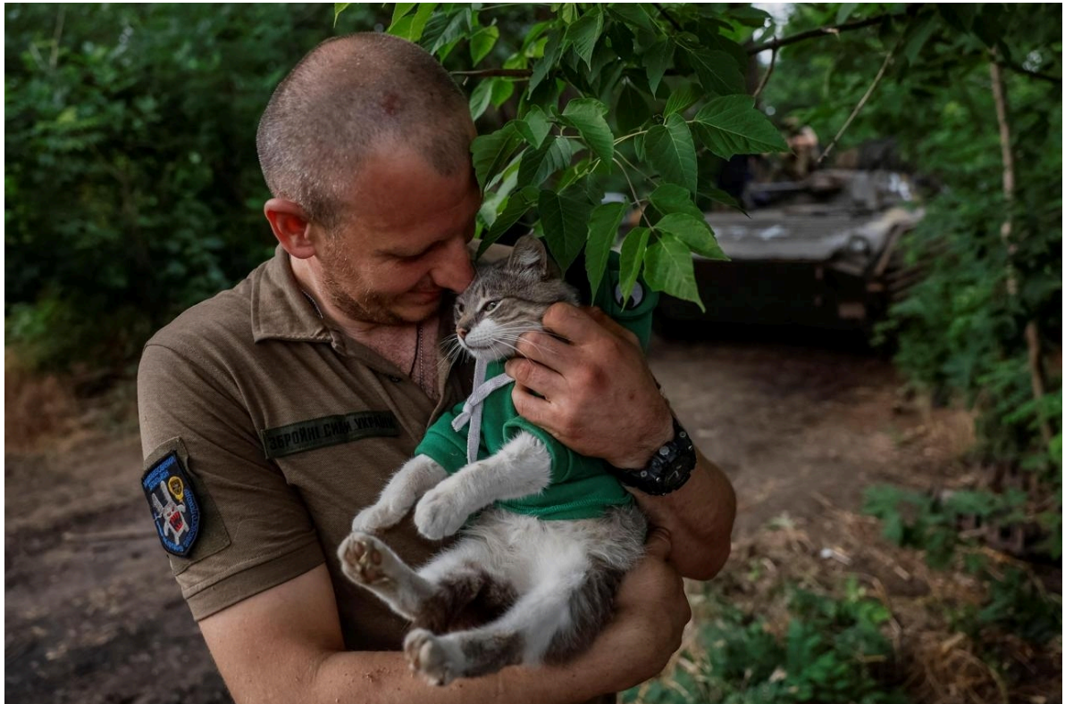
Un soldat ukrainien et le chat dans son unité près d'un véhicule de combat dans la région de Donetsk, le 14 juin 2024.

« Dans la Navy, on avait des chats de navire pour combattre les rongeurs, ils devenaient très vite des mascottes, abonde Éric Baratay. En plus de la lutte contre les rongeurs, ils avaient les mêmes fonctions que dans les tranchées : porte-bonheur, rappel de la vie en temps de paix, etc. »