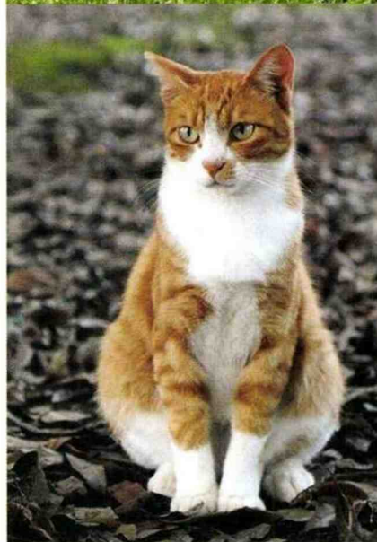
Chats (et chiens), valeurs sûres du segment.